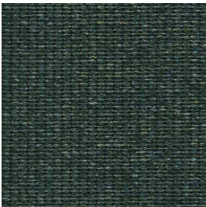
Verde Oscuro #455125