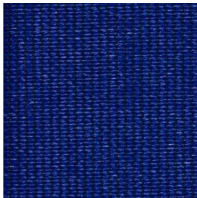
Azul Acuático #455118

Estos colores son una representación solamente. Debe de anticiparse ligeras variaciones de color.